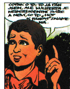
Ilustrace Marko Čermáka

ochoz – vyvýšené místo, plocha na zdech stavby, po které se dá chodit, původně chodník na středověkých hradních nebo městských hradbách, sloužil pro obchůzky stráží