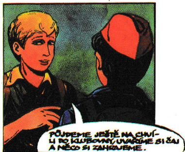
Ilustrace Marko Čermáka

„Obejdeme kostel dvěma směry,“ navrhl Mírek. „Sejdeme se zase zde u vrat. Snad najdeme vhodnou cestu dovnitř!“ Vydal se pak s Rychlonožkou nalevo, zatímco Jindra a Jarka šli směrem opačným.